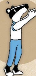
1. Kahden käden heitto sivulta eteen kuntopallolla