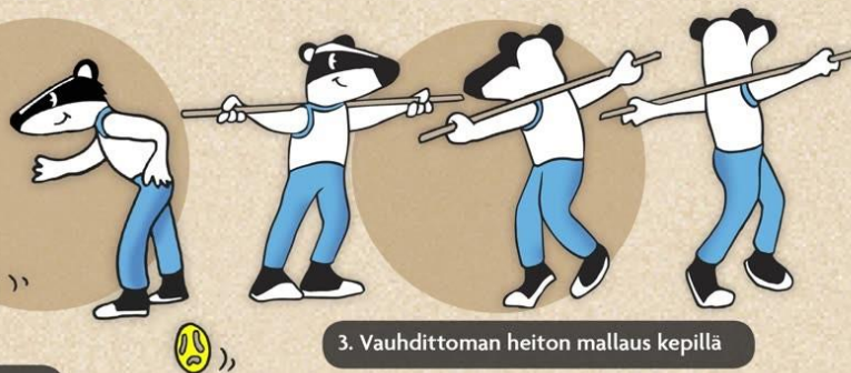
3. Vauhdittoman heiton mallaus kepillä