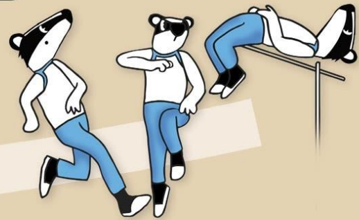
6. Korkeushypyn kokonaisuoritus