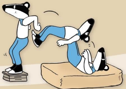
5. Taaksepäin hyppy korkeelta patjalle